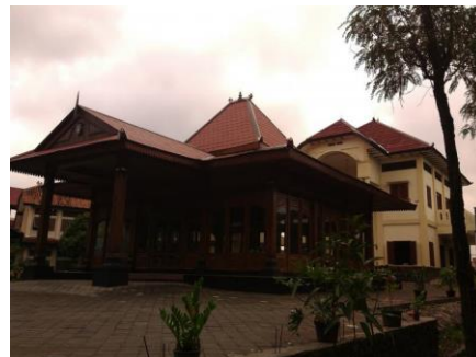
Gambar 1. 2 Kantor Kelurahan Joyosuran

Eksistensi dari dua keraton yang ada di Kota Solo juga tetap dipertahankan bahkan dijadikan objek wisata layak kunjung, mendekatkan peninggalan sejarah melalui icon budaya kepada masyarakat luas. Bentuk bangunannya mencitrakan Arsitektur Tradisional Jawa yang memiliki tipologi bangunan yang terdiri dari kaki (pondasi, lantai, umpak), badan (saka guru, tiang, dinding, pintu, jendela dan ventilasi) dan atap (rangka atap penutup atap dan langit-langit).