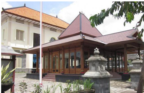
Gambar 1. 1 Kantor Kelurahan Kertan

Identitas Kota Solo sebagai Kota Budaya yang mengisyaratkan tentang kentalnya jiwa Jawa dalam karakter Kota Solo sangat terlihat pada bangunan-bangunan yang masih tetap dipertahankan bentuk aslinya dan bangunan-bangunan yang dibangun dengan unsur-unsur lokal sebagai identitas, seperti pada renovasi pembangunan kantor-kantor kelurahan. Pada bagian depan terdapat pendopo, layaknya kantor kelurahan pada jaman dulu, dimana hampir di setiap kelurahan terdapat pendopo sebagai tempat pertemuan dan berbagai acara, tetapi secara fisik pendopo mengalami perubahan, yang tadinya terbuka, sekarang tertutup dengan material kaca, disesuaikan dengan kondisi lingkungan sekitarnya, berada dipinggir jalan raya yang dilalui kendaraan, sehingga menimbulkan kebisingan. Penutupan dengan dinding bermaterial kaca merupakan upaya dalam merespon lingkungan, kebutuhan ruang pertemuan yang minim distraksi suara dan menjadi solusi yang membatasi secara fisik tetapi tidak secara visual. Keberadaan pendopo pada kantor-kantor kelurahan ini juga dihadirkan agar bersinergi dengan kantor Balaikota Solo, yang pada bagian depannya juga terdapat pendopo.