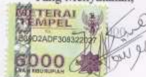
Yusuf Haikal NIM: B0515045