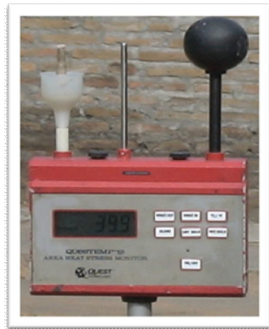
Gambar 5. Area Heat Stress Monitor