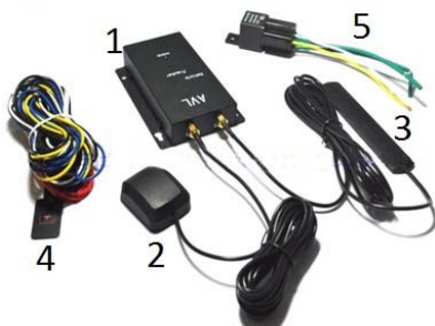
Gambar 2. Perangkat GPS

Perangkat yang digunakan dalam perancangan sistem keamanan pengiriman ini menggunakan GPS tracking dan sensor limitswitch (Gambar 2 dan Gambar 3). Fungsi dari GPS ini adalah melacak setiap gerakan dari kendaraan yang telah terpasang GPS ini. GPS mengirimkan data posisi ke server tiap periode waktu. Sensor switch disini berfungsi sebagai pemicu saat pintu belakang utama terbuka maka perangkat GPS akan mengirimkan data posisi terakhir kendaraan. Selain pintu terbuka, GPS mengirimkan data posisi ketika kendaraan berhenti dalam jangka waktu yang ditentukan dan ketika kendaraan memasuki wilayah tanpa sinyal GPS.