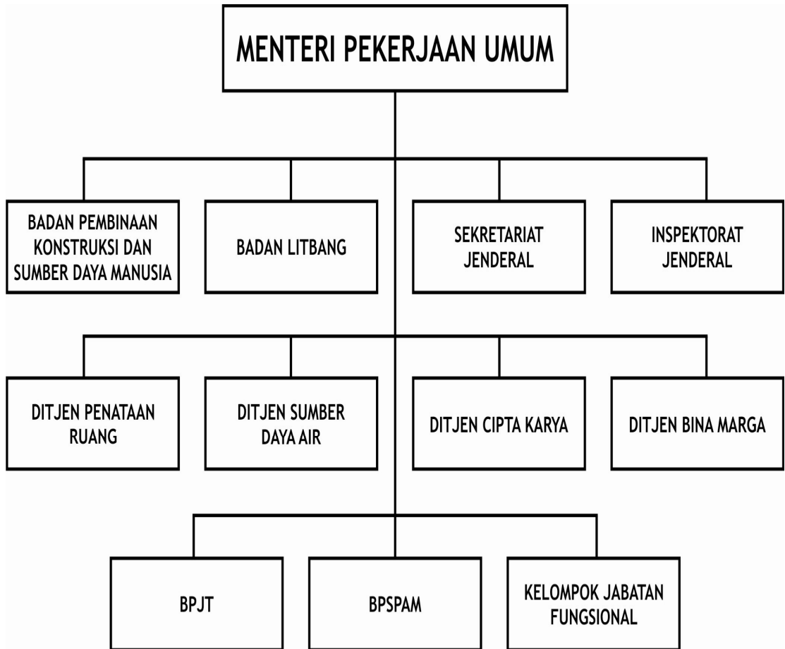
Gambar IV.1 Struktur Organisasi Departemen Pekerjaan Umum